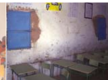
Smara: Escuela Primaria Abda (rehabilitación prevista para verano) 5