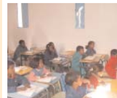
Auserd: tres nuevas aulas en tres centros de primaria 2