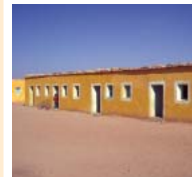
Aaiún: Escuela Primaria Daora (en rehabilitación) 1