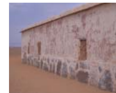
Dajla: Escuela Primaria 10 de mayo (rehabilitación prevista para verano) 7