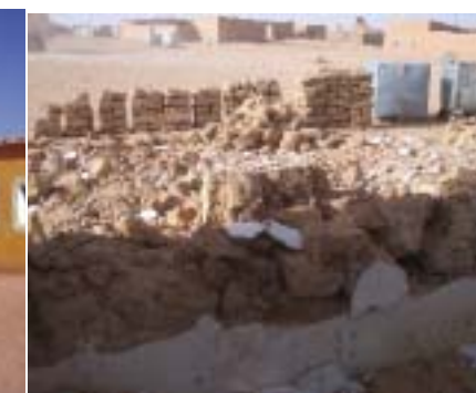
Auserd: Escuela Infantil Tichla (en rehabilitación) 2