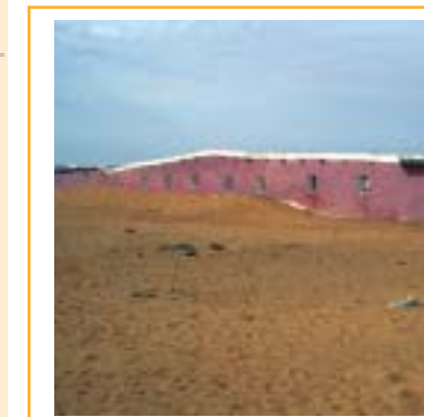
Dajla: fachada y sala multiusos de la Escuela Primaria Sidi Haidug (completamente rehabilitada) 7